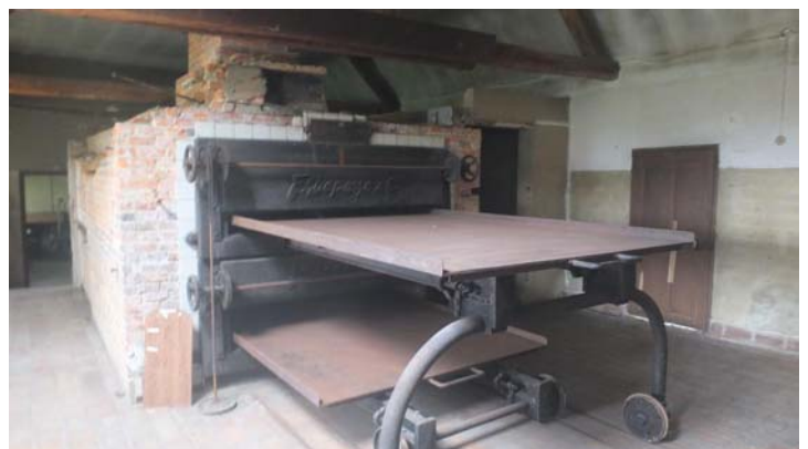
Le four à nonnettes